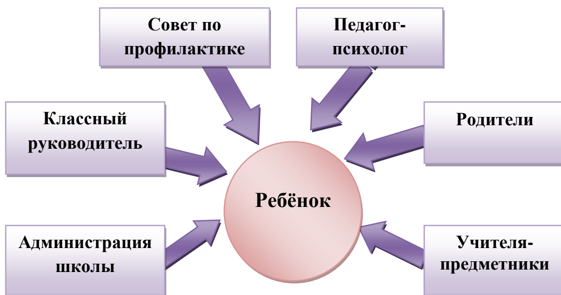
Схема сотрудничества участников воспитательного процесса по профилактике